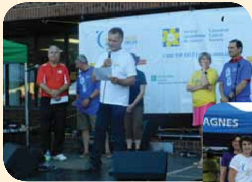
Membres du conseil, employés et familles représentant l'équipe de la Ville de Deux-Montagnes