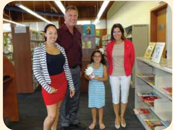
Gagnante du I-Pod, Club des aventuriers du livre